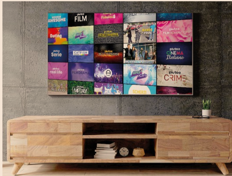
Streaming. Arriva la nuova piattaforma Pluto Tv

Che è Tv lineare in streaming, puntualizza a più riprese Jollet segnalando il track record di crescita negli altri Paesi in cui già è stato lanciato: «Sia-